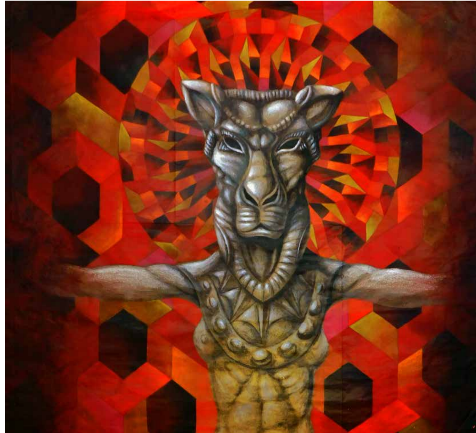
A.D. 2024 Serie EROI IN POTENZA: "LEONESSA" tecnica mista su carta 95x103 cm