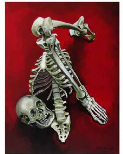
A.D. 2021.23 studio "MEMENTO MORI" olio su tela