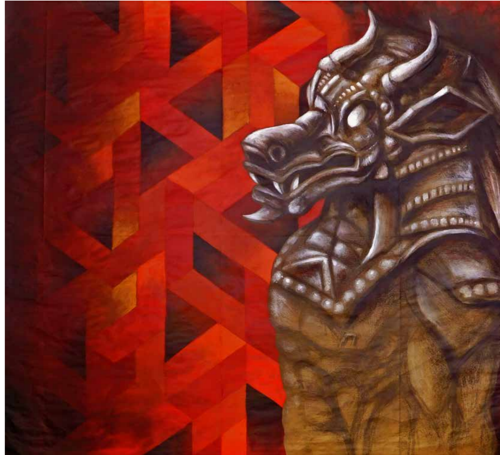
A.D. 2024 Serie EROI IN POTENZA: "DRAGO" tecnica mista su carta 95x103 cm