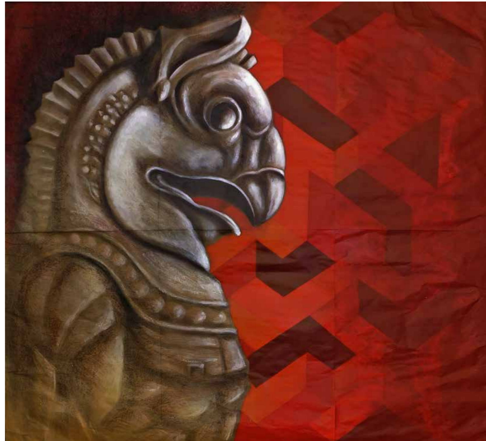
A.D. 2024 Serie EROI IN POTENZA: "GRIFONE" tecnica mista su carta 95x103 cm