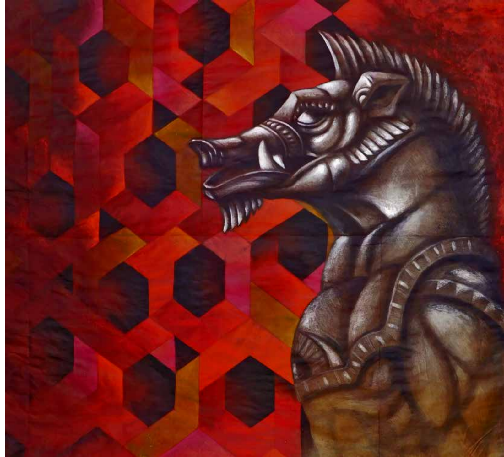
A.D. 2024 Serie EROI IN POTENZA: "CINGHIALE" tecnica mista su carta 95x103 cm