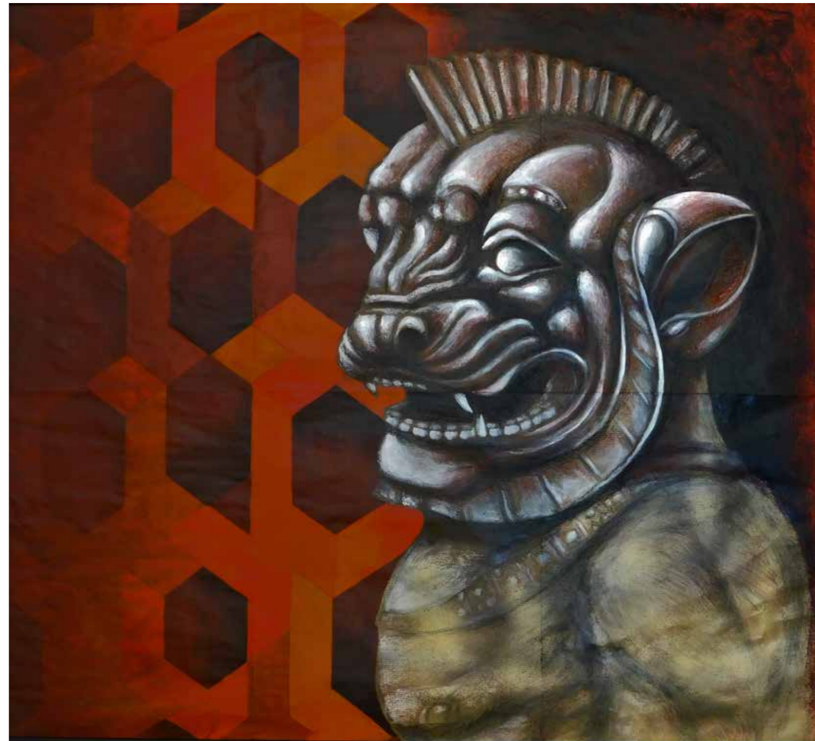
A.D. 2024 Serie EROI IN POTENZA: "LEONE" tecnica mista su carta 95x103 cm

Nicola Previati, con i suoi cicli di opere, si pone idealmente e programmaticamente fuori dalle stantie e autoreferenziali dinamiche della sedicente arte "Contemporanea". La tecnica pittorica raffinatissima, le invenzioni compositive che recuperano e attualizzano antiche maestrie e sapienze, i colori, infine, addirittura vulcanici nella loro contrastante armonia, basterebbero da soli a legittimare tali opere per se stesse, e collocarle al centro della scena della pittura contemporanea. Ma dietro queste opere c'è molto di più, la loro sfavillante fisicità è in realtà il frutto di un percorso molto più profondo, che costituisce il loro vero contenuto e valore. Esse testimoniano il recupero della radice vitale della pittura come Arte, e pongono quindi una questione ontologica che deve essere capita fino in fondo.