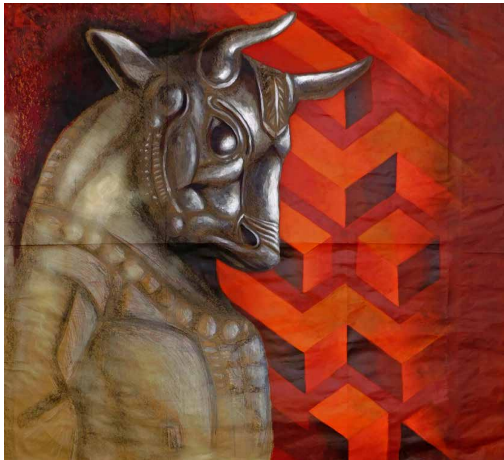
A.D. 2024 Serie EROI IN POTENZA: "TORO" tecnica mista su carta 95x103 cm