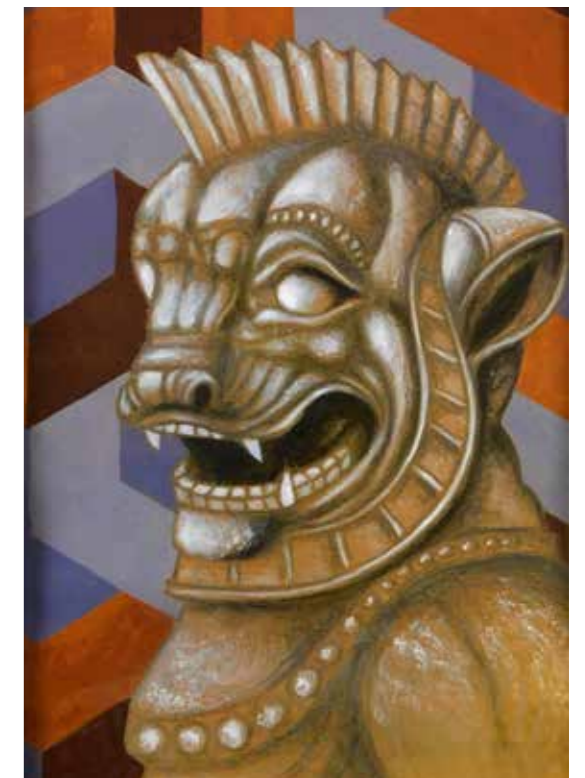
A.D. 2024 Serie EROI IN POTENZA: "STUDI DI SERIE" tecnica mista su carta